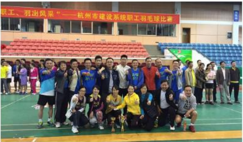
职工、羽出风采——杭州市建设系统职工羽毛球比赛